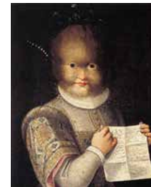
Portrait d'Antonietta Gonsalvus, Lavinia Fontana, © Château de Blois

Centre culturel de quartier Renan, 5 chemin d'Audibert, 31200 Toulouse Gratuit dans la limite des places disponibles. Réservation conseillée en ligne sur centresculturels.toulouse.fr Informations au 05 34 24 58 06