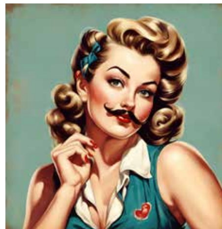
Généré par une IA

Bibliothèque 19 rue des Rossignols, 31700 Beauzelle Informations : 05 19 99 02 27