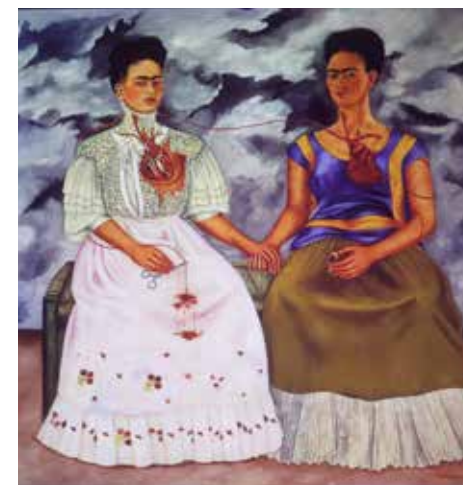
Les Deux Fridas, Frida Kahlo ©Micro_Folie